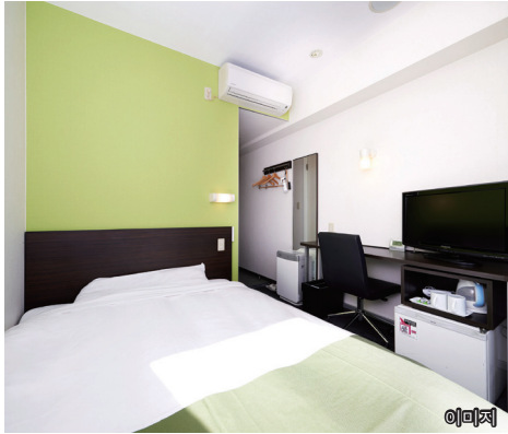
●와이드 침대【폭 150cm】