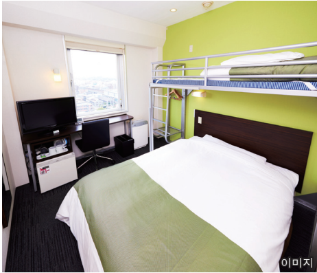
●와이드 침대【폭 150cm】 + 로프트 침대