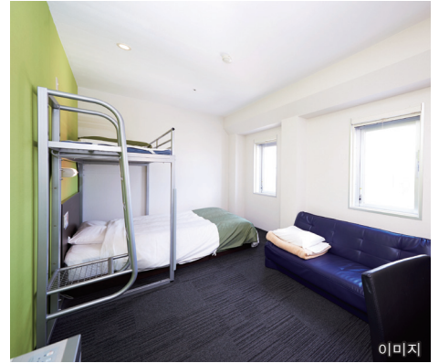
●와이드 침대【폭 150cm】 + 로프트 침대 + 소파 침대